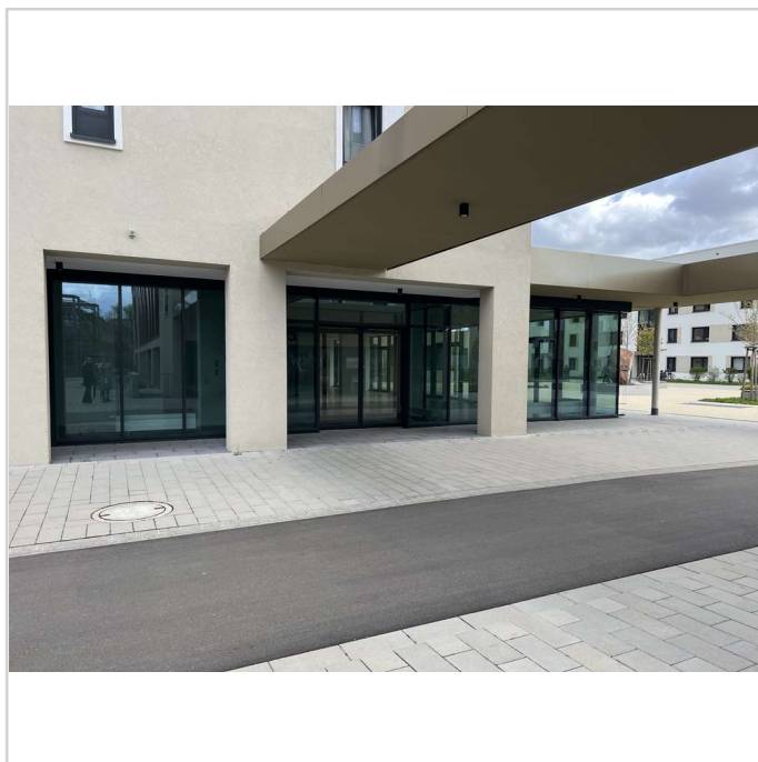
Durchgang angrenzende Apotheke