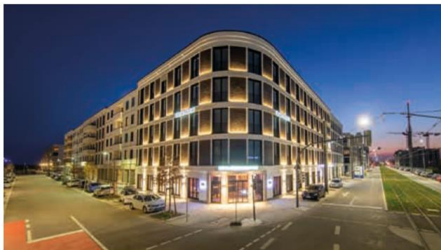
Wohnen, Arbeiten und Freizeit unter einem Dach: Der MEILEN.STEIN in der Bahnstadt.

Bereits im Herbst öffnete im Langen Anger die Kindertagesstätte „Lummerland“ für 50 Kinder zwischen sechs Monaten und sechs Jahren in der Trägerschaft der Kinderzentren Kunterbunt. Direkt um die Ecke in der Da-Vinci-Straße bietet der Unverpackt-Laden „mitohne“ unter an-